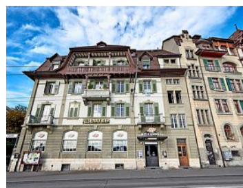
Das Bierhübeli.